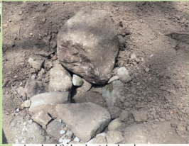
かまどもあります